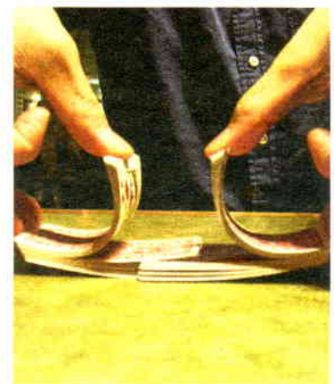
Am 8. März kann man im Gasthof Rubenthaler beim Preiswatten mitspielen.

FÖROLACH. Die Burschenschaft Pressegggen-Förolach lädt am Samstag, 8. März , zum Preiswatten ein. Veranstaltungsort ist der Gasthof „Zum Rubenthaler“, mit Beginn um 19 Uhr . Nenngeld ist 15 Euro pro Person. Natürlich gibt es viele tolle Geld- und Sachpreise zu gewinnen.