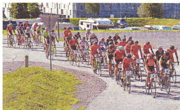
Über hundert Teilnehmer waren bei der 16. Nassfeld-Rad-Classic um die „Wulfenia-Trophy“ am Start.